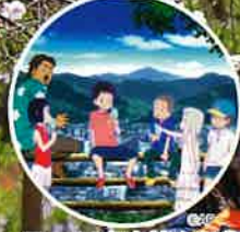
アニメの舞台地めぐり