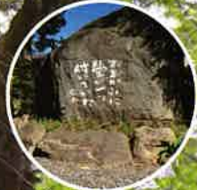
皆野吟行ウォーク