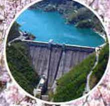
浦山ダム内部ウォーク