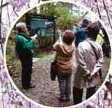
長瀬ジオガイドウォーク