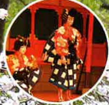
小鹿野歌舞伎のまち