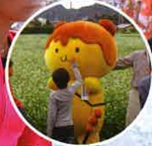
ポケたまくと撮影

主催 ● 秩父いってんべえウォーキング2Days実行委員会(秩父市・横瀬町・皆野町・長瀬町・小鹿野町)・NPO法人埼玉県ウォーキング協会 共催 ● 秩父地域おもてなし観光公社 後援 ● 埼玉県、埼玉県教育委員会、朝日新聞さいたま総局、埼玉新聞社、産経新聞さいたま総局、テレ玉、東京新聞さいたま支局、NHKさいたま放送局、毎日新聞さいたま支局、読売新聞さいたま支局 協力 ● NPO法人埼玉県ウォーキング協会加盟団体、秩父まるごとジオパーク推進協議会、荒川ダム総合管理所 協賛 ● 株式会社矢尾本店酒づくりの森、有限会社新井武平商店、カリフォルニア・レーズン協会